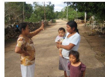
Une femme malentendante signe avec une femme entendante lors d'une rencontre fortuite dans la rue

qui est utilisée à la fois par les personnes malentendantes et par la population générale. Dans un tel contexte où l'usage de la langue des signes est répandu au sein de toute une population, les personnes malentendantes peuvent participer librement à la vie sociale de la communauté et ne sont pas ostracisés du reste de la population. Cette situation diffère de l'expérience des malentendants ailleurs sur la planète qui considèrent être membres d'un groupe culturel distinct appelé la « culture des Sourds ». 2 ⇒