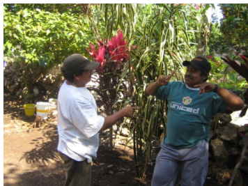
Deux hommes communiquent avec la langue des signes.

La situation des malentendants à Chican présente des circonstances exceptionnelles pour analyser la relation entre communication et intégration sociale. Le ratio des personnes malentendantes dans cette communauté par rapport aux personnes entendantes est d'environ 30 pour 1000 alors que la moyenne mondiale est normalement de 1 pour 1000. 1 Il est intéressant de noter que les habitants de Chican ont développé une langue des signes élaborée, qui est indépendante de la langue des signes mexicaine, et