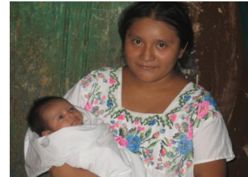
Une mère malentendante et son nouveau-né.

Dans le cadre de ma recherche, j' examine le rôle de la langue des signes dans l'expérience sociale des peuples indigènes de la région rurale de Yucatán au Mexique. Je me concentre plus précisément sur le phénomène de l'usage de la langue des signes parmi les personnes malentendantes et entendantes au sein d'une communauté maya, appelée Chican, située dans la municipalité du Tixmehuac. J'explore en réalité les attitudes face à la surdité et la communication de manière général. Je considère également l'influence de l'histoire sociocoloniale sur la définition qu'ont les habitants de cette région de leurs modèles locaux. Cette recherche me permet aussi d'expliquer la complexité du concept d'identité au sein de cette population en comparant la compréhension locale à des classifications sociales externes.