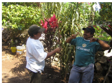
Deux hommes communiquent avec la langue des signes.

La situation des malentendants à Chican présente des circonstances exceptionnelles pour analyser la relation entre communication et intégration sociale. Le ratio des personnes malentendantes dans cette communauté par rapport aux personnes entendantes Y g h ' X Đ Y b j p d u r e 1 0 0 0 alors que la moyenne mondiale est normalement de 1 pour 1000. 1 Il est intéressant de noter que les habitants de Chican ont développé une langue des signes élaborée, qui est indépendante de la langue des signes mexicaine, et