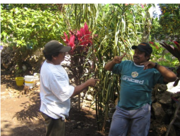
Deux hommes communiquent avec la langue des signes.

La situation des malentendants à Chican présente des circonstances exceptionnelles pour analyser la relation entre communication et intégration sociale. Le ratio des personnes malentendantes dans cette communauté par rapport aux personnes entendantes Y g h ' X Đ Y b j p d u r e 1 0 0 0 alors que la moyenne mondiale est normalement de 1 pour 1000. 1 Il est intéressant de noter que les habitants de Chican ont développé une langue des signes élaborée, qui est indépendante de la langue des signes mexicaine, et