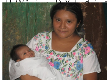
Une mère malentendante et son nouveau-né.

8 U b g ' ` Y ' W U X f Y ' X Y ' a U ' f Y W \ Y f W \ Y ž : ^ Đ ' Y I U a ] b Y ' ` Y X U b g ' ` Đ Y I d f f ] Y b W Y ' g c W ] U ` Y ' X Y g ' d Y i d ` Y g ' ] b X ] [ ] Yucatán au Mexique. Je me concentre plus précisément sur le phénomène X Y ' ` Đ i g U [ Y ' X Y ' ` U ' ` U b [ i Y ' X Y g ' g ] [ b Y g ' d U f a ] ' ` Y g Y b h Y b X U b h Y g ' U i ' g Y ] b ' X Đ i b Y ' W c a a i b U i h f ' a U m U ž ' U d ' U ' a i b ] W ] d U ` ] h f ' X i ' H ] l a Y \ i U W " i ' Đ Y I d ' g f Y ' Y b ' f f les attitudes face à la surdité et la communication de manière général. Je considère f [ U ` Y a Y b h ' ` Đ ] b Z ` i Y b W Y ' X Y ' g i f ' ` U ' X f Z ] b ] h ] c b ' e i Đ c b h région de leurs modèles locaux. Cette recherche a Y ' d Y f a Y h ' U i g g ] ' X Đ Y I d ` ] e i W c b W Y d h ' X Đ ] X Y b h ] h f ' U i ' g Y ] b comparant la compréhension locale à des classifications sociales externes.