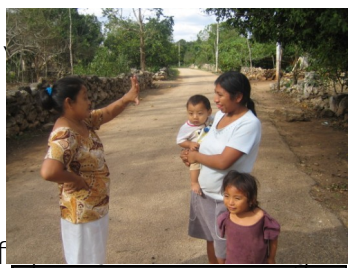
Une femme malentendante signe avec une femme entendant lors

qui est utilisée à la fois par les personnes malentendantes et par la population générale. Dans i b ' h Y ` ' W c b h Y l h Y ' c - ' ` Đ i g U [ Y ' X répandu au sein de toute une population, les personnes malentendantes peuvent participer librement à la vie sociale de la communauté et ne sont pas ostracisés du reste de la population. Cette g ] h i U h ] c b ' X ] Z Z , f Y ' X Y ' ` Đ Y I d f f ailleurs sur la planète qui considèrent être membres X Đ i b ' [ f c i d Y ' W i ` h i f Y ` ' X u l t u r e d e s W h f o w p g " O t g p e q p v t s " h q t v w k v Sourds ». 2 ⇒